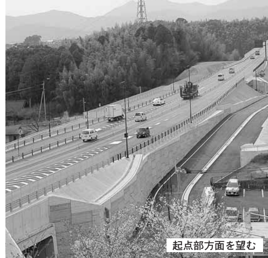
起点部方面を望む

国道3号熊本北バイパス(熊本市北区四方寄~合志市須屋間1.8km)が3月28日に暫定2車線で部分開通し、事業化から41年越しに整備延長7.6kmが全線開通した。地域の主要幹線道路としてだけでなく、東バイパスと連結して熊本市東部圏の環状道路を形成する主要道路としても位置付けられており、全線開通によって交通状況の改善や、経済への波及効果など多くの好影響を生み出すことが期待されている。