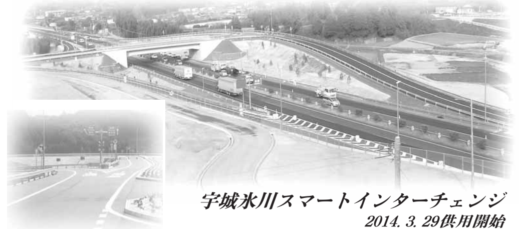
宇城氷川スマートインターチェンジ 2014. 3. 29供用開始

〒869-4815 八代郡氷川町鹿島 1618-2 TEL 0965-52-0743 FAX 0965-52-3279