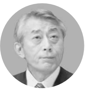
西日本高速道路株式会社