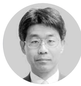
国土交通省熊本河川国道事務所