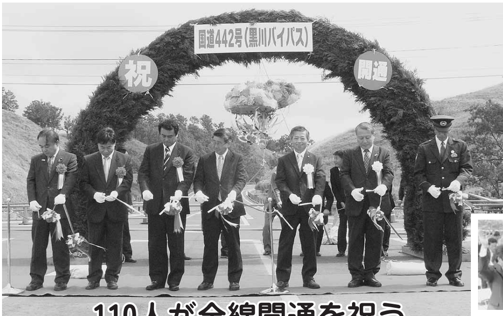
110人が全線開通を祝う

阿蘇地域振興局が平成8年度から取り組んでいた国道442号「黒川バイパス」が10月1日に全線開通した。総事業費約52億円を投入し、県道別府一の宮線の交差点から黒川温泉入口までの全長4.5km区間をバイパス化。交通車両の安全確保はもとより、黒川温泉を核とした観光振興や阿蘇地域、九州中北部の産業や経済の活性化が期待されている。